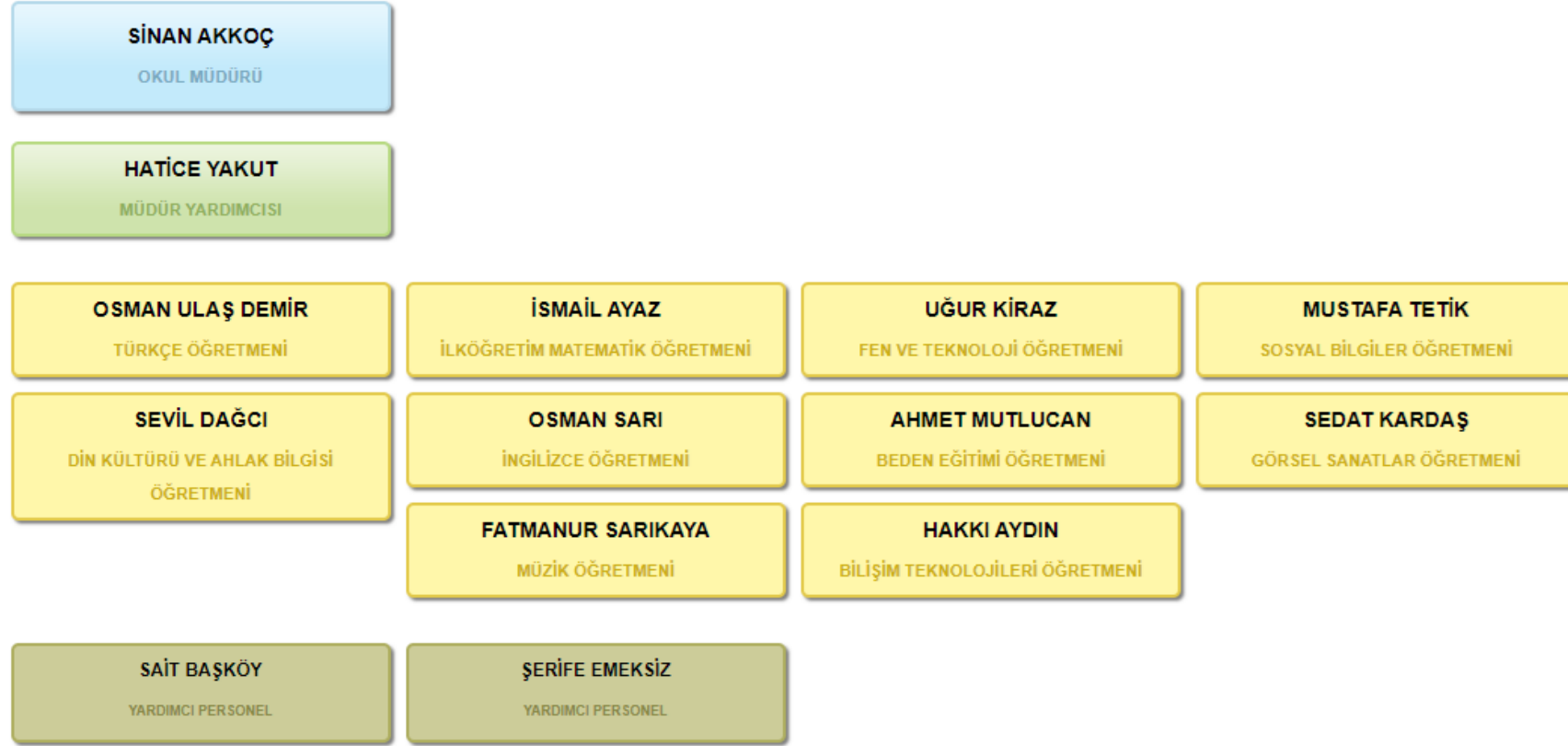
Şekil 1: Organizasyon Şeması